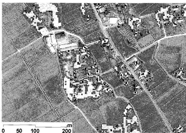
図-3 抽出した屋敷林とその重点点