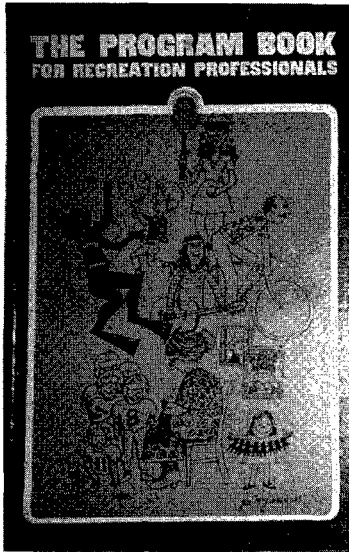
写真3. The Program Book for Recreation Professionals