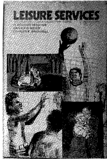
写真4. Leisure Services